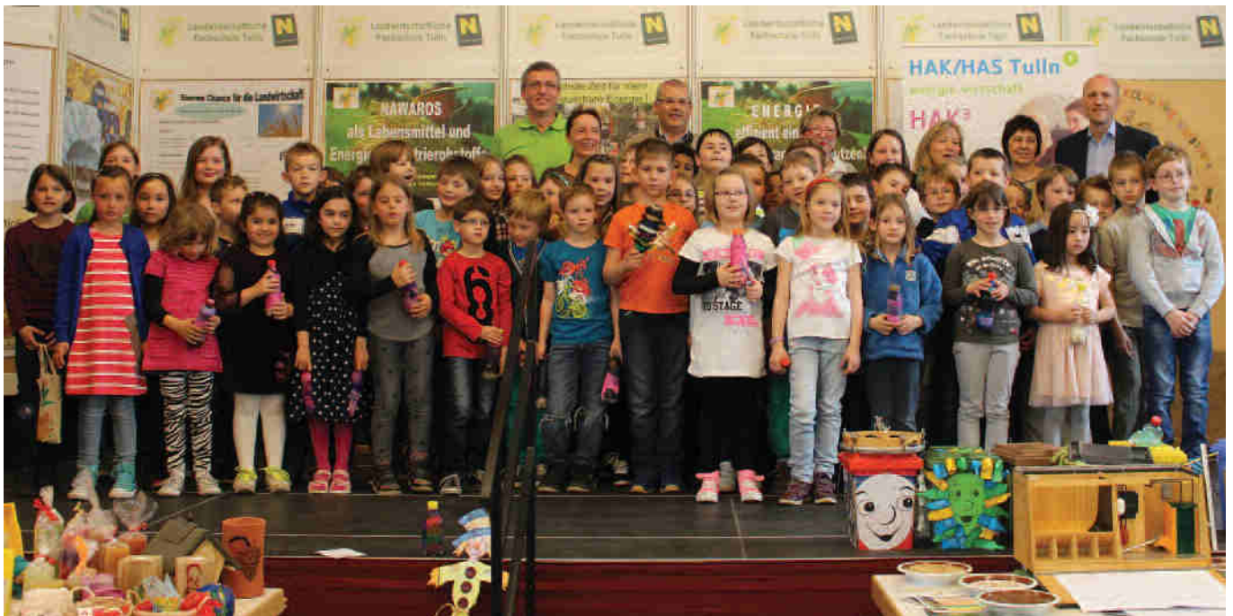
Chor der Volksschule Absdorf

Ein besonderes Highlight des Tages war die Darbietung der Kinder der Volksschule Absdorf. Seit einigen Jahren beschäftigen sich die Lehrerinnen im Unterricht sehr intensiv mit dem Thema Umwelt. Mit großer Begeisterung sangen die Kids 3 Lieder zum Thema Umwelt. Eines davon wurde auch in englischer Sprache dargeboten, weil es im Rahmen eines gemeinsamen EU-Projekts entstanden ist.